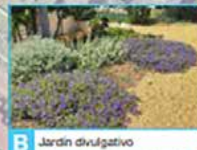
B Jardín divulgativo