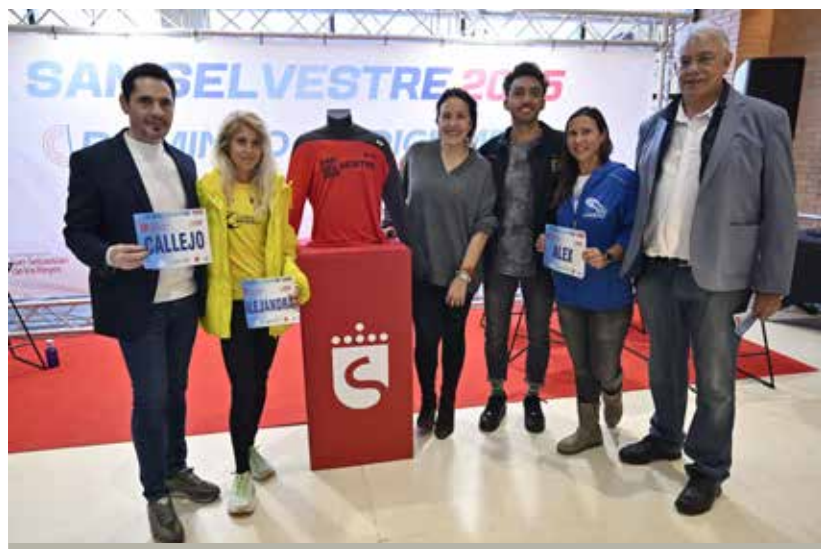
Presentado el circuito oficial de carreras de San Sebastián de los Reyes.