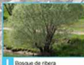
I Bosque de ribera