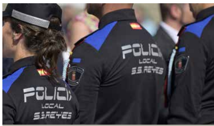
Sigue aumentando la seguridad: la criminalidad bajó en nuestra ciudad un 3,3 % en el cuarto trimestre de 2024, según los datos del Ministerio del Interior.