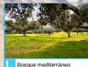
L Bosque mediterráneo