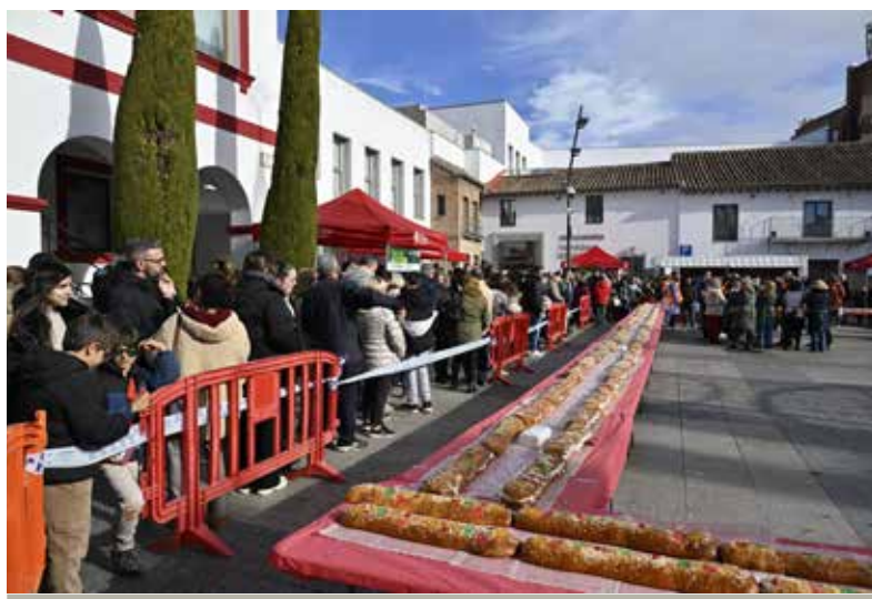
Nuestra ciudad acoge el mayor evento solidarios realizado en España para apoyar a los enfermos de ELA.

Accede a la noticia de Canal Norte Digital