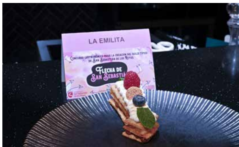
La Emilita gana el concurso de la Flecha de San Sebastián, el dulce típico oficial de la ciudad.

Accede a la noticia de Canal Norte Digital