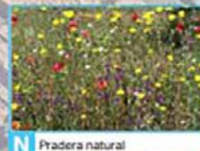
N Pradera natural