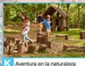
K Aventura en la naturaleza