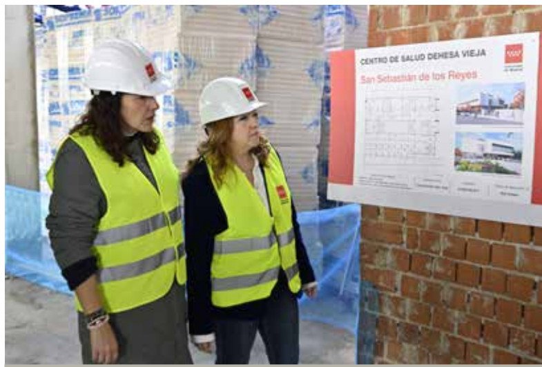
Avanzan las obras del nuevo centro de salud de Dehesa Vieja, que dará cobertura a 26.000 vecinos.