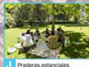
J Praderas estanciales