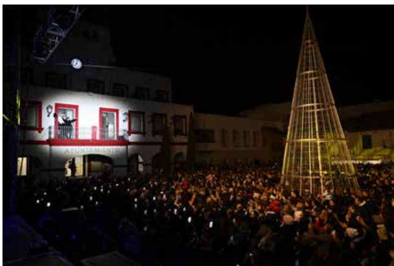
David Bustamante protagoniza el inicio de la programación navideña de San Sebastián de los Reyes.

Accede a la noticia de Canal Norte Digital