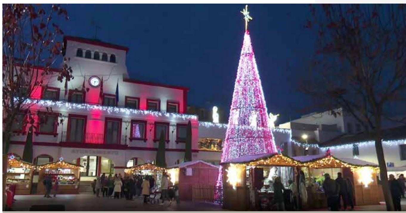
Por ti creamos magia: las actividades navideñas llenan la ciudad de ilusión.