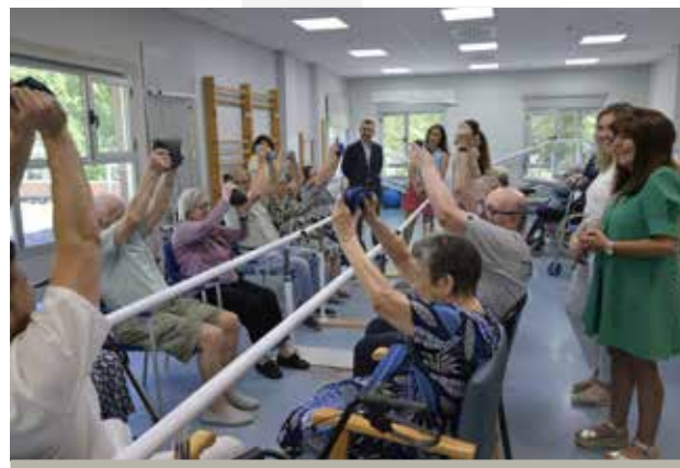
La Comunidad de Madrid aumenta un 28% la inversión en la residencia Moscatelares.