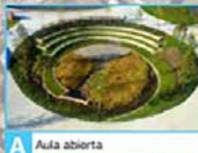
A Aula abierta