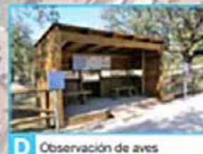
D Observación de aves