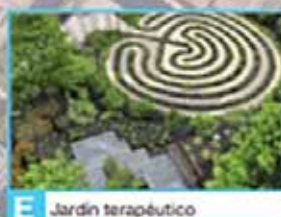
E Jardín terapéutico