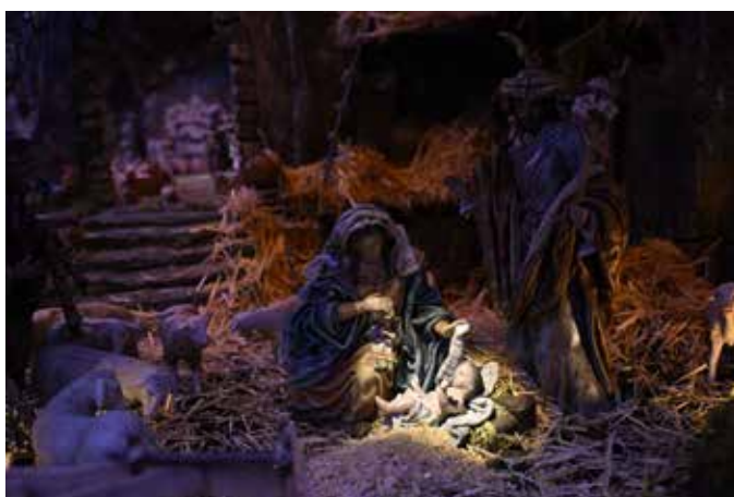
El Belén Monumental de San Sebastián de los Reyes, uno de los grandes atractivos de la Navidad en nuestra región.