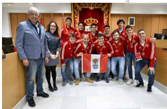
El club Sanse Hockey Complutense hace historia en Europa: los equipos femenino y masculino logran el tercer puesto en el Eurohockey Club Indoor.