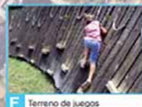
F Terreno de juegos